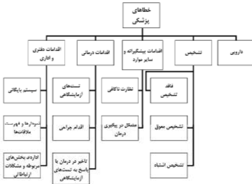
نمای ۱: انواع خطاهای پزشکی در مؤسسات مراقبت سلامت