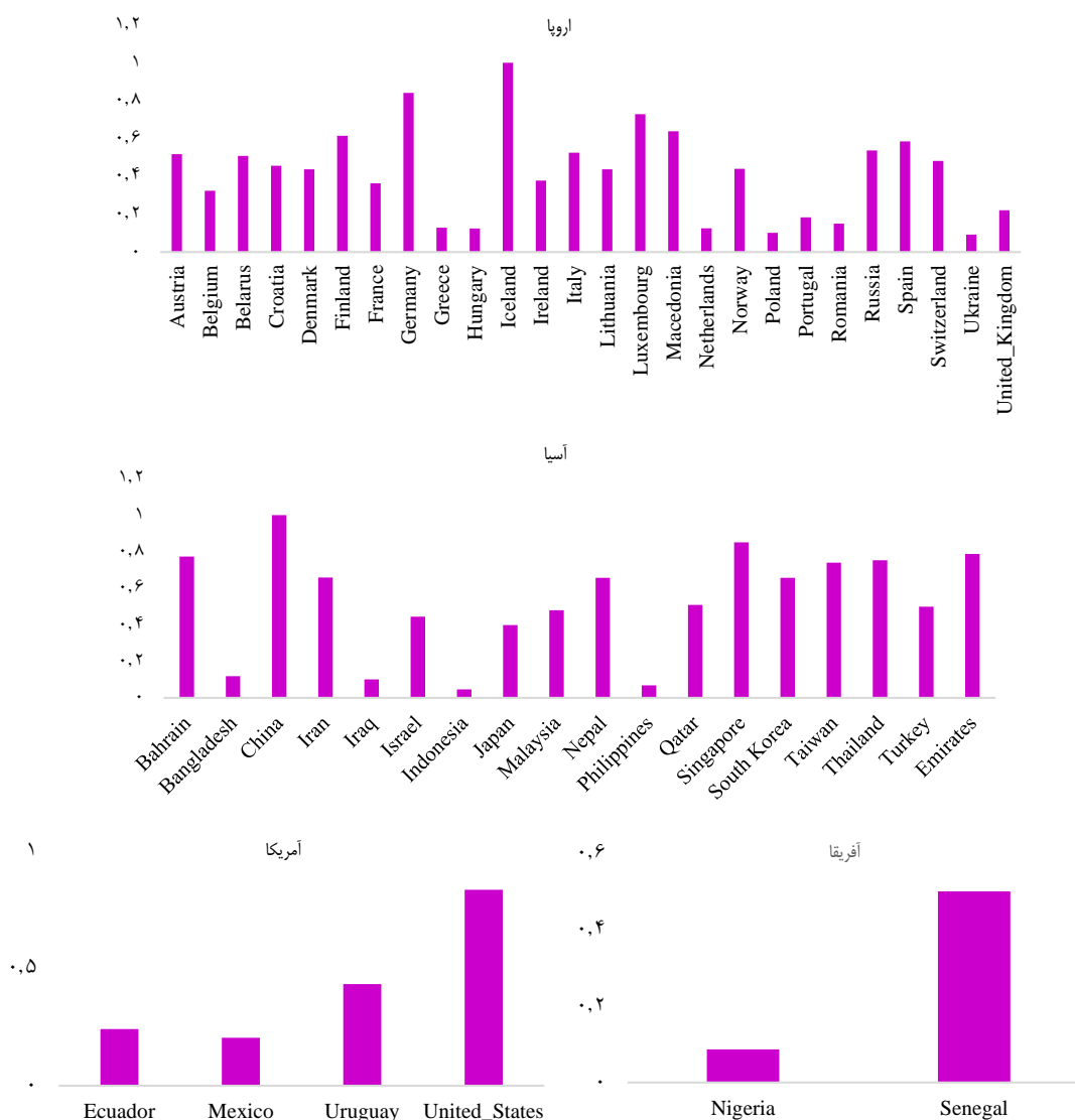
شکل ۳: میزان کارایی کل کشورهای منتخب به تفکیک قاره

موفق برای سایر کشورها تبدیل شوند. با بررسی کتابخانه‌ای می‌توان سیاست‌ها و اقدامات این کشورها در مواجهه با این بیماری را به سه دسته «اقدامات مهارکننده (قرنطینه، اعمال محدودیت‌ها، ممنوعیت‌ها و سایر موارد)، اقدامات مالی و سیاست‌های پولی (حمایت دولت برای جبران خسارات و اعطای تسهیلات به صاحبان کسب، اقشار کم‌بضاعت و سایر موارد)، تدابیر در سیستم و سازمان‌های بهداشتی (کافی بودن تجهیزات پزشکی، ایجاد بستر نرم‌افزاری جهت شناسایی افراد آلوده و زنجیره ارتباطی آن‌ها و سایر موارد)» (۲۱-۲۳) تقسیم کرد. در کل، این کشورها در هر یک از موارد سه‌گانه، به صورت تخصصی به موضوع نگاه کرده بودند و سیاست‌های مناسب را بسته به شرایط محلی، در سطح استانی و منطقه‌ای تدوین و در قالب بخشنامه‌های مناسب ابلاغ نموده‌اند (۲۳).