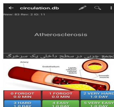
شکل ۲: نمونه‌ای از محتوای تولید شده در نرم افزار

یافته‌ها در خصوص بررسی تأثیر استفاده از نرم افزار کمک آموزشی همراه و محتوای تولید شده بر روی تعداد دفعات مطالعه نشان داد که ۶۶/۷ درصد از دانشجویان قبل از استفاده از نرم افزار همراه بیان کردند که استفاده از نرم افزار کمک آموزشی می‌تواند در تعداد دفعات مطالعه آن‌ها در درس اصطلاحات پزشکی تأثیر بگذارد و بعد از استفاده از آن، ۹۱/۷ درصد از نمونه‌ها اذعان نمودند که نرم افزار همراه و محتوای تولید شده بر روی تعداد دفعات مطالعه آن‌ها در درس اصطلاحات پزشکی تأثیرگذار بوده است. بر اساس نتایج آزمون McNemar، بین استفاده از نرم افزار همراه و تأثیر آن بر روی تعداد دفعات مطالعه دانشجویان ارتباط معنی‌داری مشاهده شد ( P = 0/100 ).