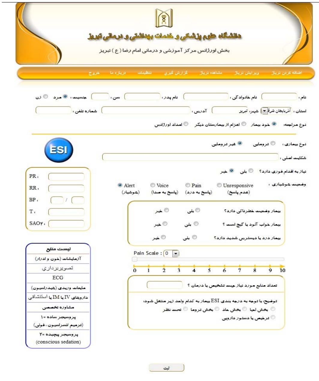
شکل ۱: مقایسه الگوریتم تریاژ ESI و صفحه ثبت تریاژ